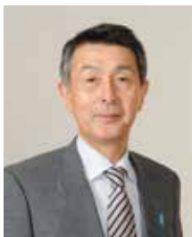
にいがたBIZ EXPO 2015 実行委員会 委員長