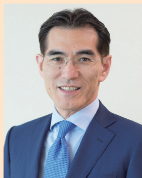
ウェルズアドバイザー 株式会社 代表取締役社長