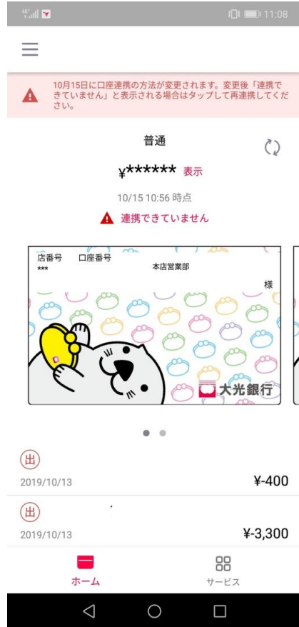
(1)「連携できていません」をタップ