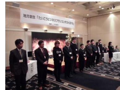
【たいこうビジネスプランコンテストの様子】